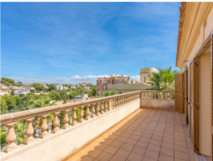
Balcony of 30 sqm with lovely views