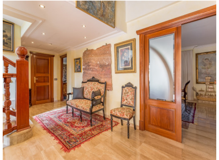
The generous house was built in 2004