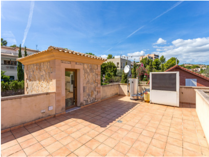
90 sqm roof terrace