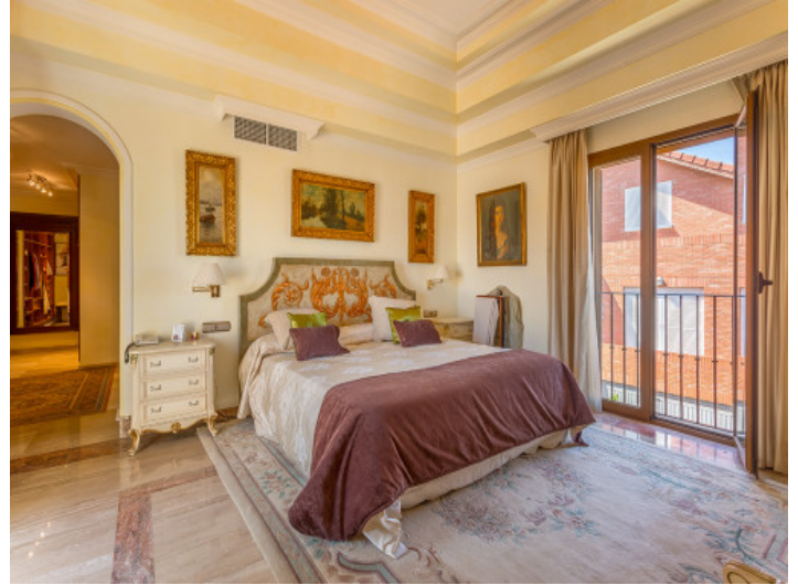
Master bedroom with dressing area