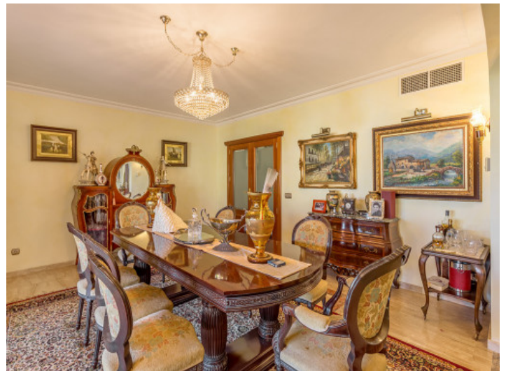
Dining area with antique furniture