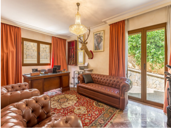
Office with seating area and access to the outside