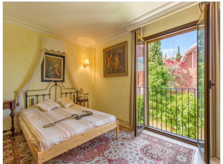
One of 8 bedrooms with natural light