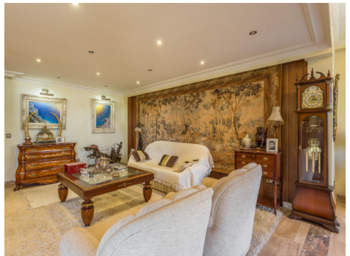
Living area in a traditional style

All information is correct to the best of our knowledge. Errors and prior sale excepted. This prospectus is purely for information purposes. Only the notarized deed of sale is legally binding.