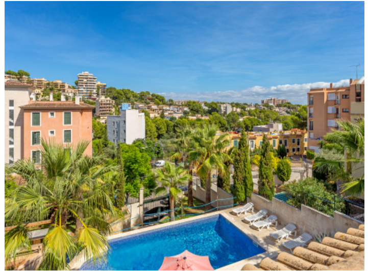
Views to the beautiful pool area