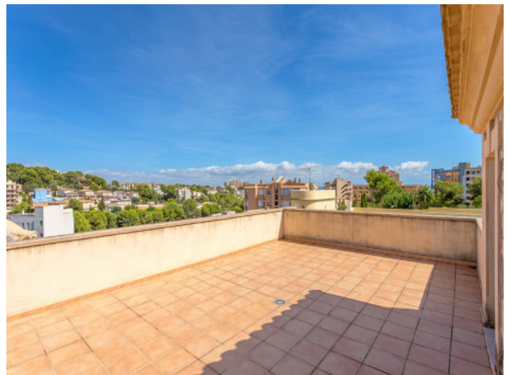
The large roof terrace offers views to the surroundings

All information is correct to the best of our knowledge. Errors and prior sale excepted. This prospectus is purely for information purposes. Only the notarized deed of sale is legally binding.