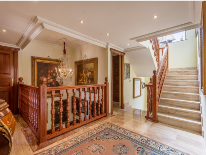
The impressive house has a living surface of 668 sqm