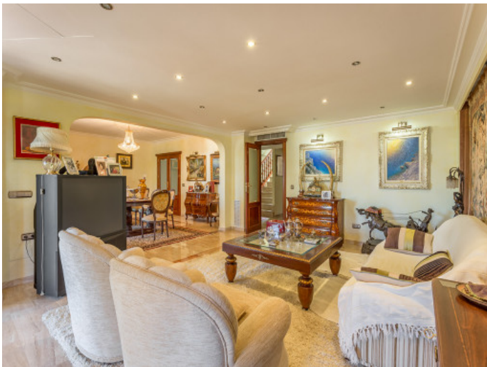
Spacious living and dining area of 100 sqm