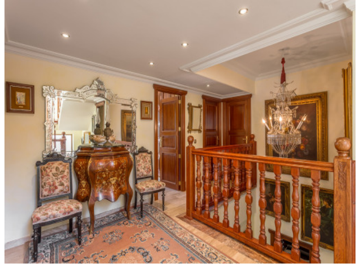
Open gallery on the upper floor