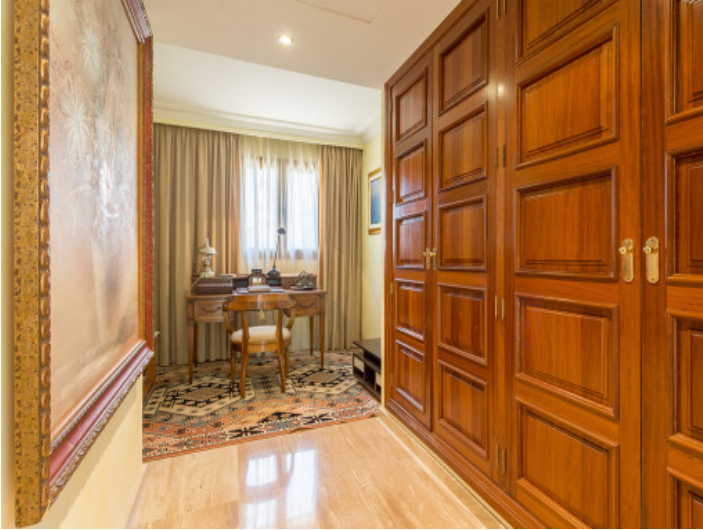
Further office corner with roomy fitted wardrobes