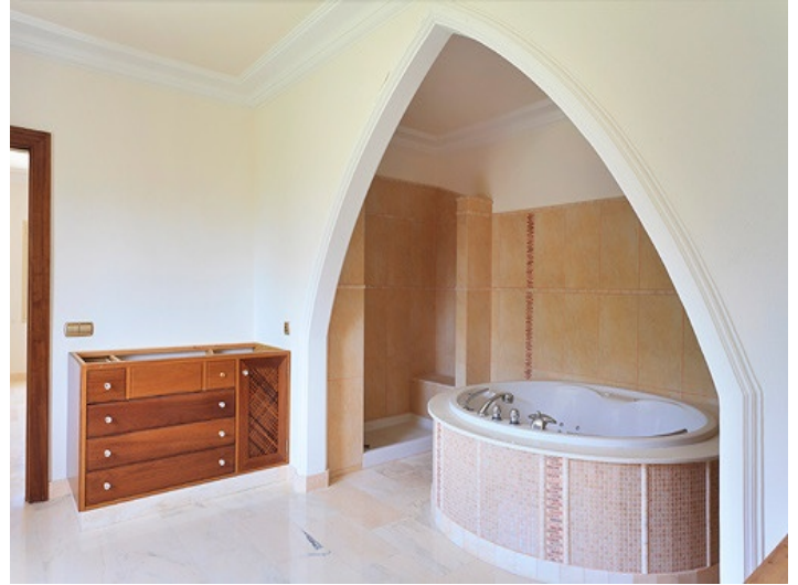
Jacuzzi in the main bathroom on the ground floor