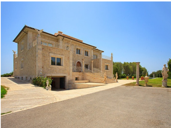
View of the mansion from the driveway

All information is correct to the best of our knowledge. Errors and prior sale excepted. This prospectus is purely for information purposes. Only the notarized deed of sale is legally binding.