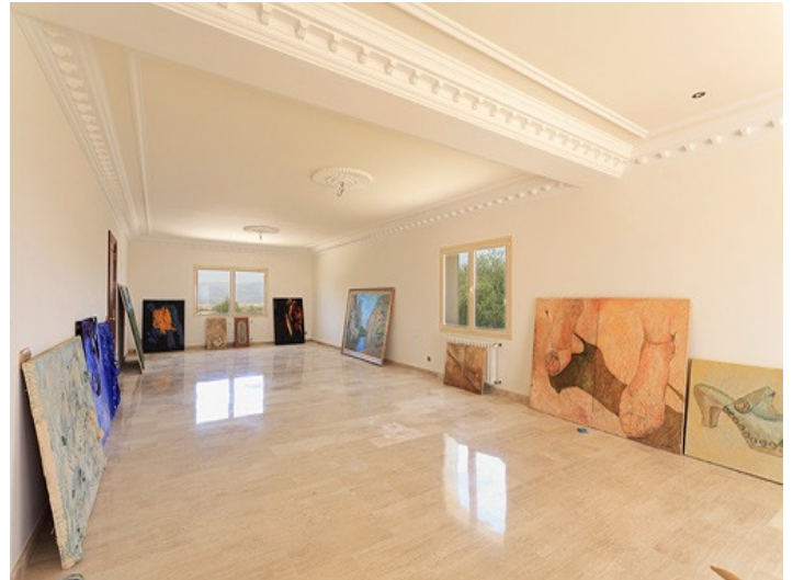
Spacious terraces of the master bedroom