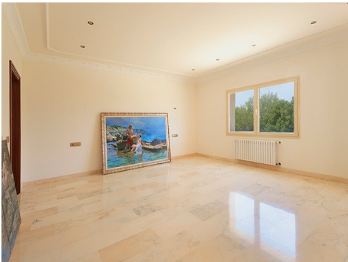
Under the dome impresses the ceiling fresco