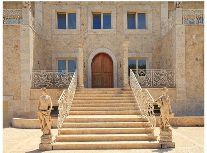
Impressive entrance of the property