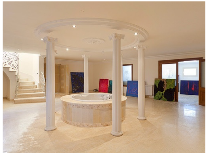
An U-shaped stair with an intermediate landing leads to the gallery