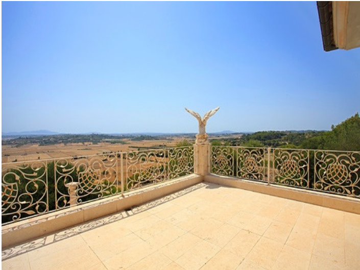
Front view of the fantastic mansion in Muro