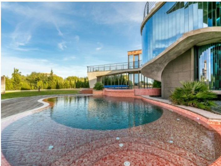
Breath-taking pool area