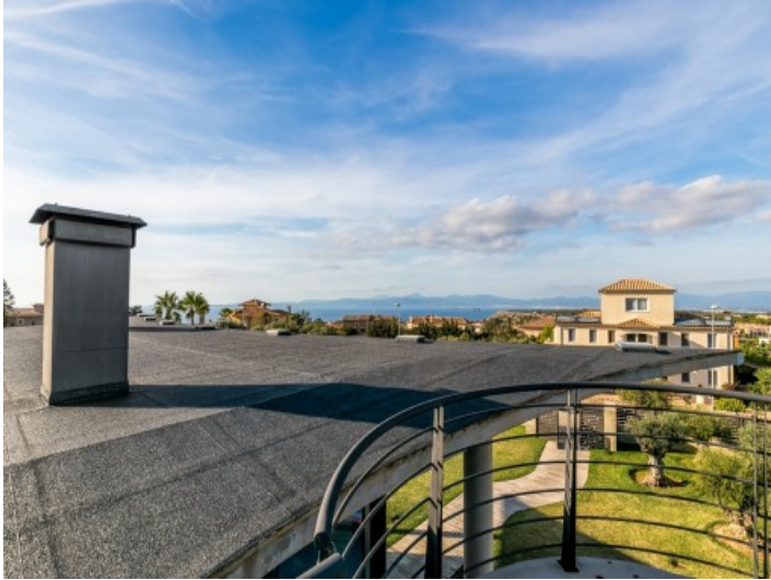
Wonderful panoramic views