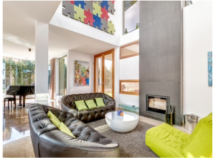
Light flooded living area with fireplace