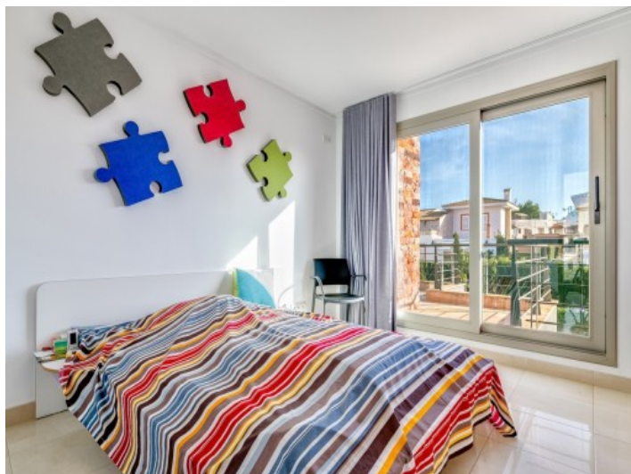
One out of 5 bedrooms