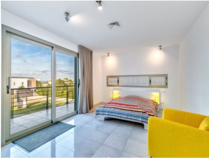
Double bedroom with balcony access