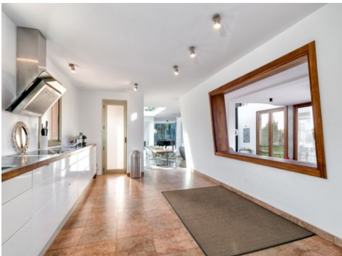
Modern and spacious kitchen