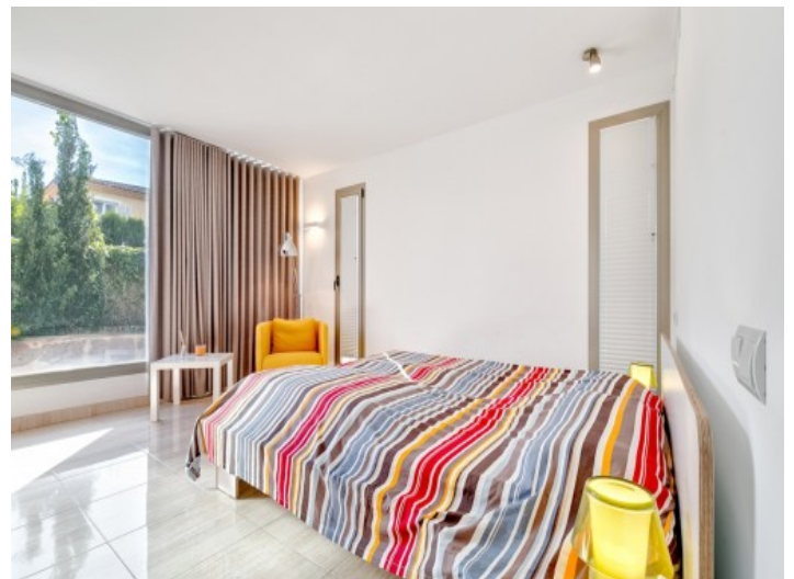
Friendly guest bedroom

All information is correct to the best of our knowledge. Errors and prior sale excepted. This prospectus is purely for information purposes. Only the notarized deed of sale is legally binding.