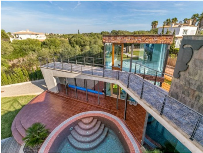
Great garden and pool area