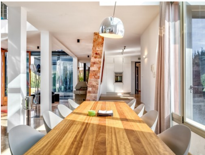
Large dining area