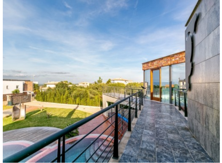
The villa has a separate guest house