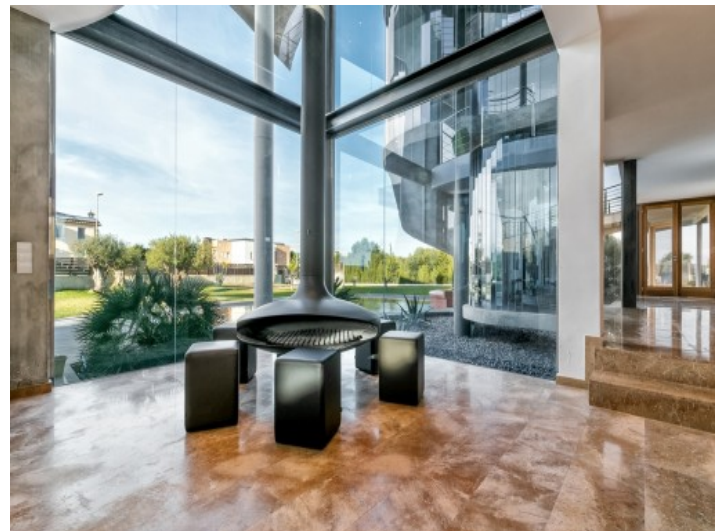
Stylish chillout area with garden views and fireplace