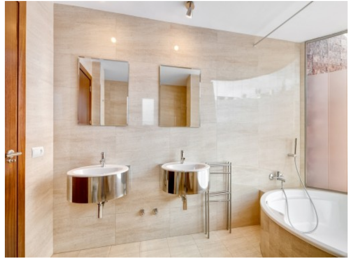
Noble bathroom with bathtub and natural light