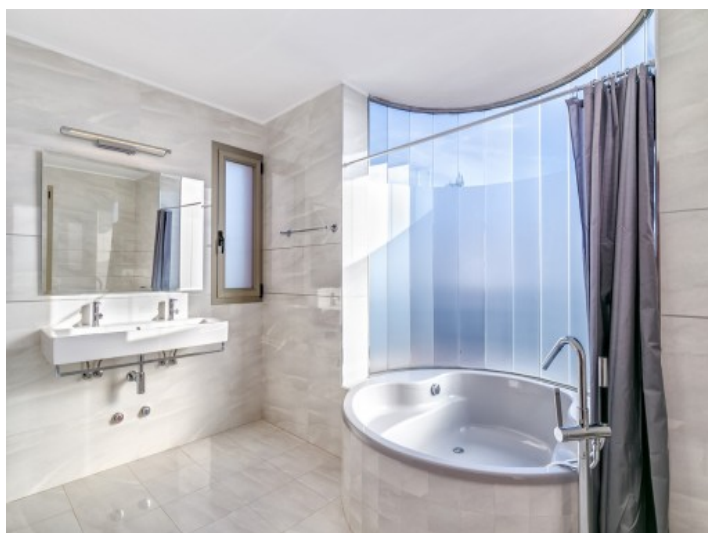
One out of 5 bathrooms with comfortable bathtub