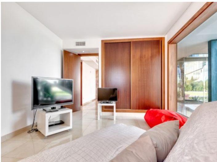
Guest room with built-in wardrobe