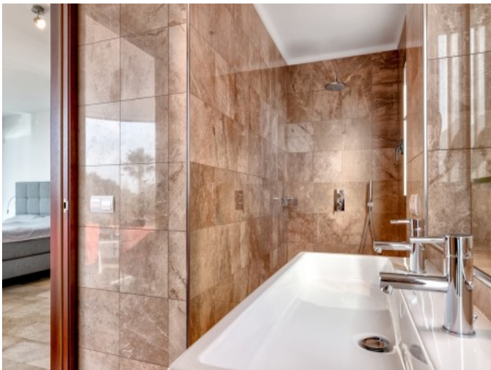
Master bathroom en suite with shower