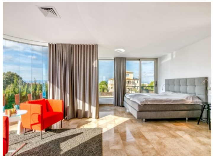
Capacious master bedroom with fantastic glass façade

All information is correct to the best of our knowledge. Errors and prior sale excepted. This prospectus is purely for information purposes. Only the notarized deed of sale is legally binding.